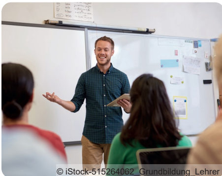
Grundbildung_Lehrer

Dieser Kurs ist für alle Interessenten gedacht, die sich als Anfänger mit dem Computer und dessen Anwendungsmöglichkeiten vertraut machen wollen. Ihnen werden die Grundlagen von Windows inklusive Ordnungssystem für Dateien und Ordner gezeigt, Sie bekommen eine Einführung in